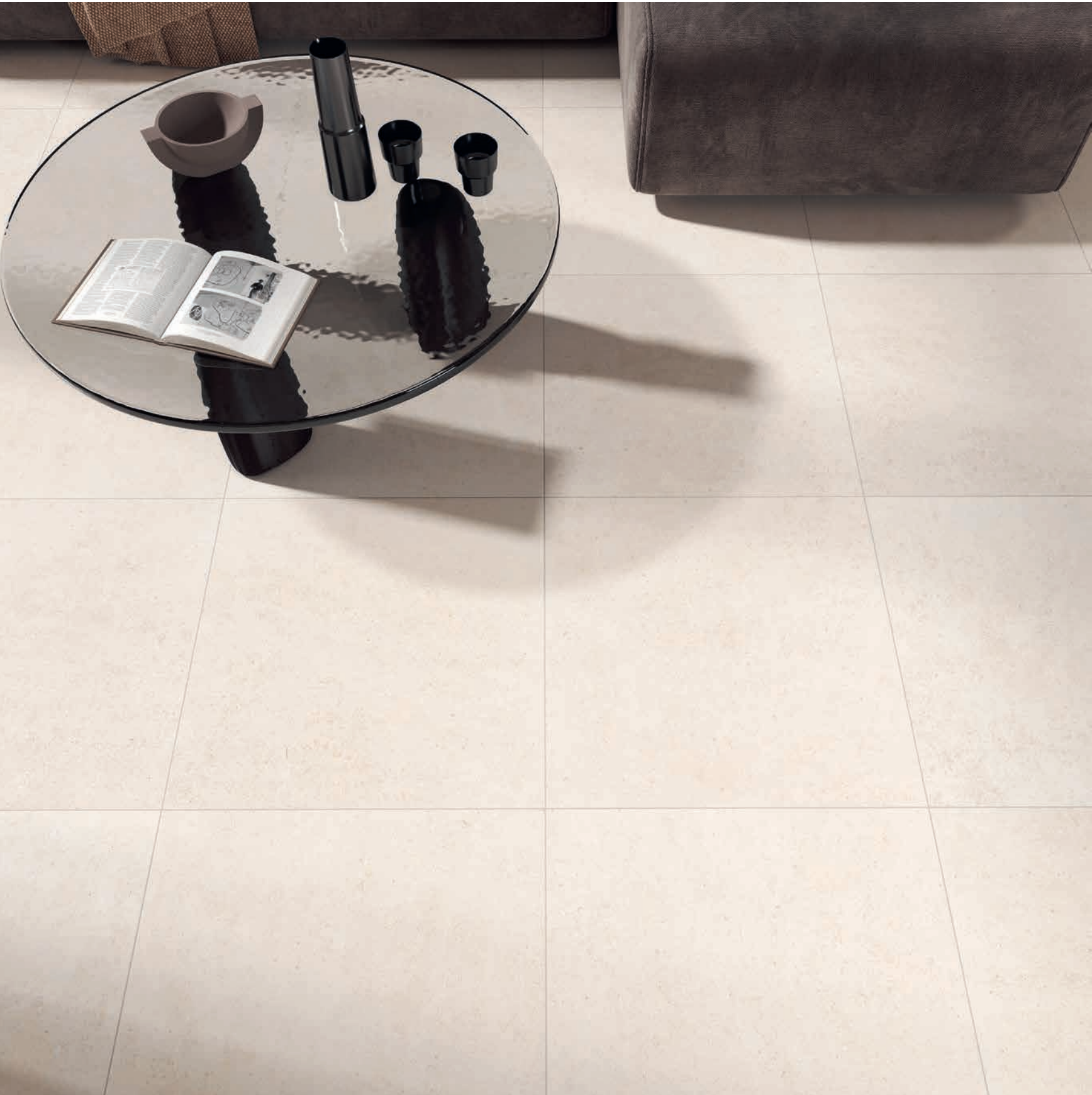
floor bianco 60x60 rect